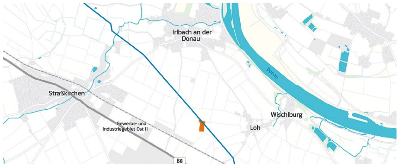
In Irlbach wird ein neues Umspannwerk der Bayernwerk Netz GmbH errichtet

Die elektrische Versorgung des Montagewerks für Hochvoltbatterien soll durch mehrere unterirdisch verlegte 110-Kilovolt-Kabel erfolgen, die an ein neues Umspannwerk der Bayernwerk Netz GmbH in Irlbach angeschlossen werden. Die BMW Group wird zwei eigene Transformatoren mit einer maximalen Bezugsleistung von 68 Megawatt auf dem Werksgelände errichten.