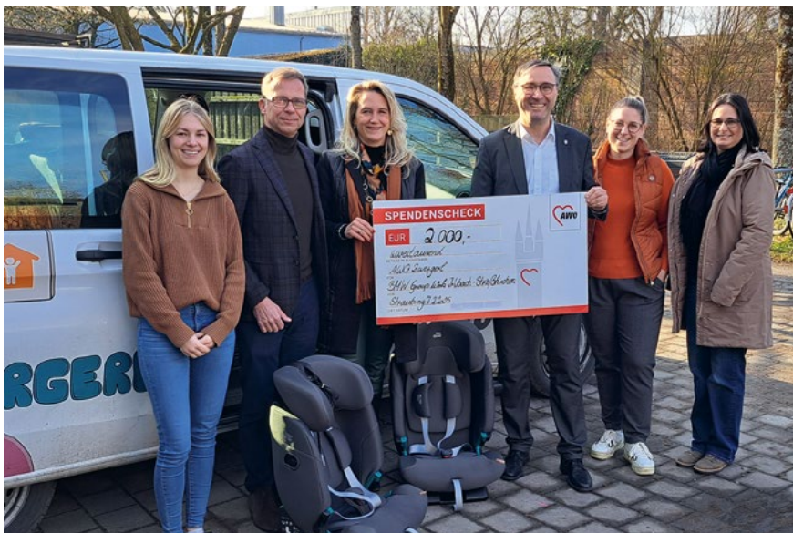
Vertreterinnen und Vertreter der AWO Straubing und der BMW Group Unternehmenskommunikation bei der Spendenübergabe

Ein besonderer Spendenübergabetermin hat bei der heilpädagogischen Kleinkinderwohngruppe AWO (Arbeiterwohlfahrt) Zwergerl stattgefunden. Das in Irlbach-Straßkirchen entstehende BMW Group Werk spendete 2.000 Euro, womit für die Kinder dringend benötigte Kindersitze angeschafft werden können.