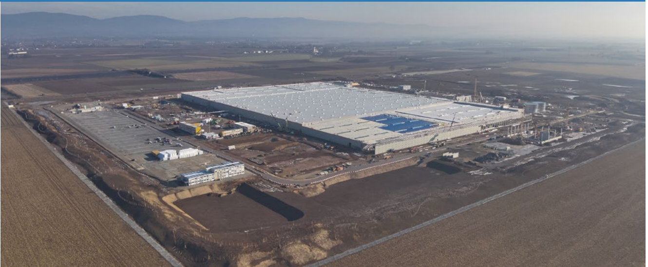
Aktuelle Luftaufnahme des neuen Montagewerks für Hochvoltbatterien in der BMW Group in Irlbach-Straßkirchen

1.400 Personen verpflegen. Anfang nächsten Jahres sollen das Gebäude und der gastronomische Betrieb für die Mitarbeitenden vor Ort eröffnet werden.