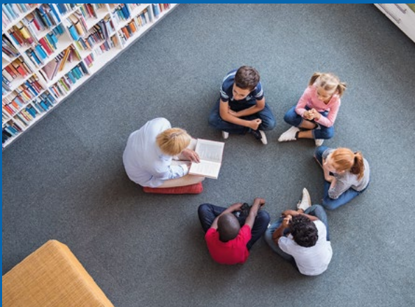
Der Sommerferien-Leseclub war ein voller Erfolg

Kindern Spaß am Lesen schöner, neuer und spannender Bücher zu vermitteln, ist das Ziel der Gemeindebücherei Straßkirchen. Erstmals beteiligte sie sich in diesem Jahr am bayernweiten Leseförderungskonzept „Sommerferien-Leseclub“ (SFLC). Neben dem Bewerten der gelesenen Bücher konnten sich die Kinder auch beim Malen künstlerisch betätigen und ihrer Fantasie freien Lauf lassen.