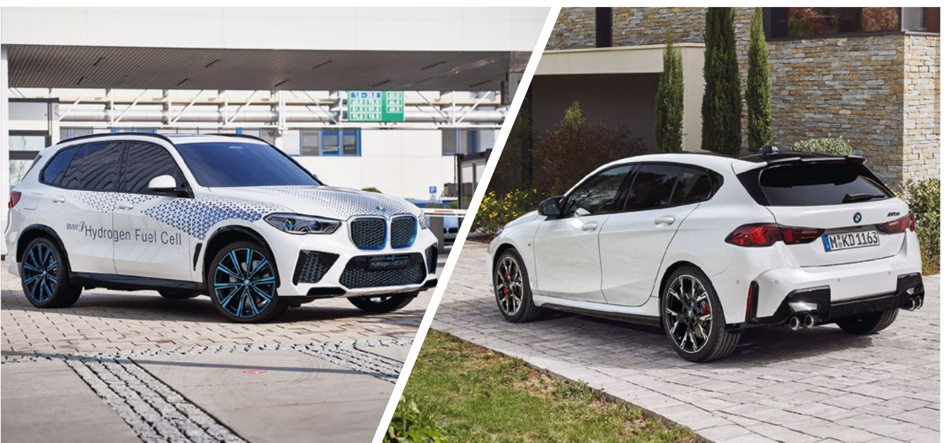
BMW iX5 Hydrogen: Innovationstreiber mit Wasserstoffantrieb

Um neue Technologien nutzen zu können, brauchen wir ein gut ausgebautes Netz an Tankstellen und Lade-stationen. Die BMW Group legt den Fokus auf die Ausweitung der Infrastruktur und die Optimierung der Lade-schnelligkeit und schafft Angebote, die flächendeckendes und kundenfreundliches Laden ermöglichen.