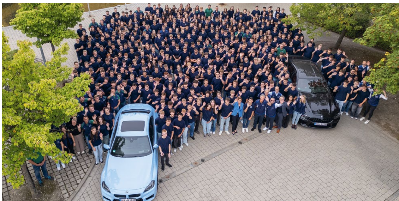
Ausbildungsstart im BMW Group Werk Dingolfing

Erstmals zusätzliche Azubi-Plätze für den künftigen BMW Standort Irlbach-Straßkirchen