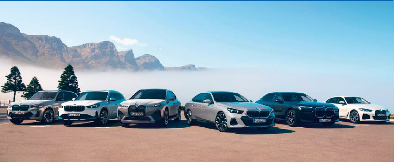
Vollelektrische Produktpalette der BMW Automobilen des Modelljahres 2024 – Angebot sorgt für Nachfrage