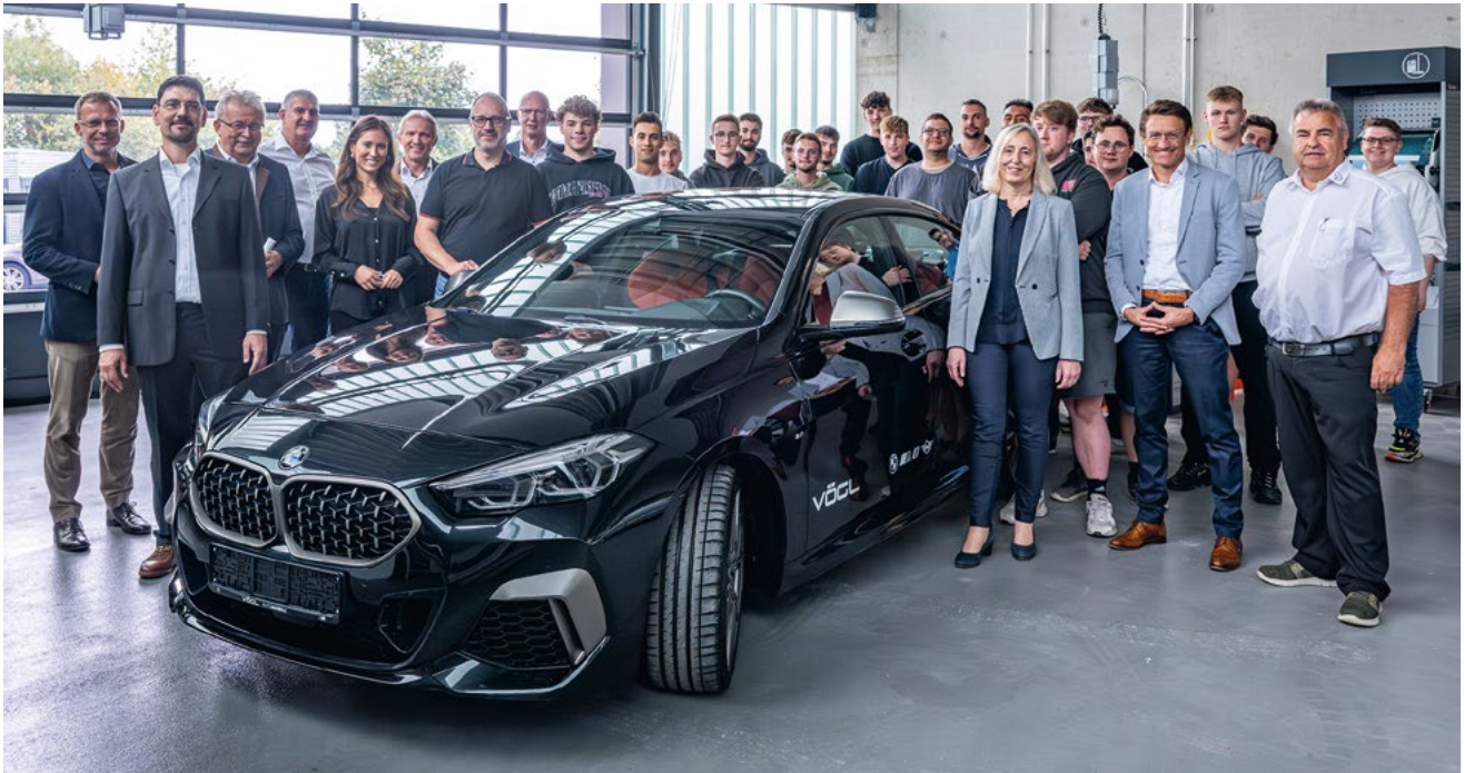
Alle Beteiligten freuten sich über das neue Ausbildungsfahrzeug, einen BMW M235i

Seit kurzem steht ein BMW M235i bei der Berufsschule I in Straubing-Bogen, übergeben von dem BMW Group Werk Dingolfing. Die Idee dahinter: Lernen nah an der Praxis, am Puls der Zeit und mit Spaß-Faktor – eine vielversprechende Kombination, um gut ausgebildete Fachkräfte hervorzubringen.