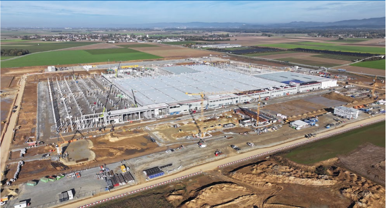
Das Baufeld aus der Vogelperspektive. Stand: Oktober 2024