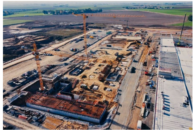
In der sogenannten „Zwischenspanne“ haben im Sommer die Bauarbeiten für die Nebengebäude begonnen