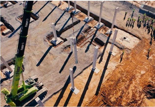
In rund 100 Arbeitstagen wurden insgesamt 1.066 Betonstützen am Baufeld aufgestellt

Die erste Stütze stand am 24. Juni 2024 und symbolisierte den offiziellen Start des Hochbaus für das neue Montagewerk. Nur 16 Wochen später, am 17. Oktober, wurde die letzte der insgesamt 1.066 Stützen des zentralen Produktionsgebäudes aufgerichtet. Sichtbare Fortschritte am Rohbau sind zudem der Einbau von Brandwänden und Treppenhäusern, das Betonieren der Decken, die Installation des Dachtragwerks sowie das Anbringen der Dachbleche inklusive erster Dachabdichtungen.